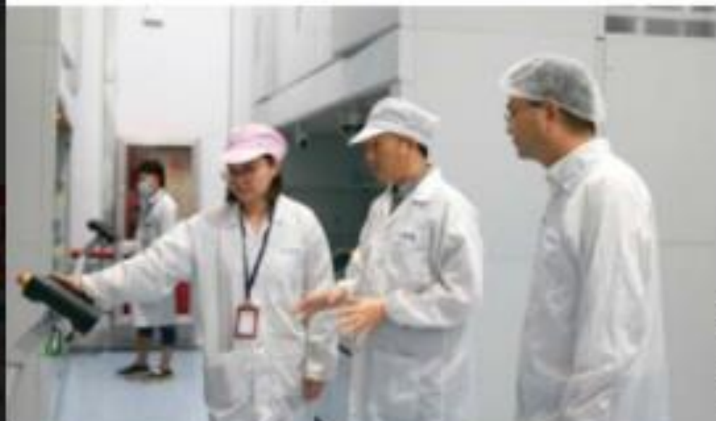
En Chine, Eolane va ouvrir une deuxième usine et veut atteindre 100 millions d'euros de chiffre d'affaires sous quatre ans, contre 50 millions d'euros actuellement.

Pour accompagner son développement, Eolane va investir cette année à hauteur de 12 millions d'euros. Investissements réalisés dans le cadre de son projet stratégique Alizés, qui vise à transformer ses activités vers l'industrie 4.0 sur l'ensemble de ses sites en France et à l'étranger, avec entre autres l'installation d'une nouvelle ligne de production dans l'usine historique de Combrée, en Maine-et-Loire, qui emploie 380 personnes. Soutenu par France Relance, le projet porte sur 2 millions d'euros. Le groupe de 2 500 collaborateurs, dont 1 400 dans l'Hexagone, est présent sur trois