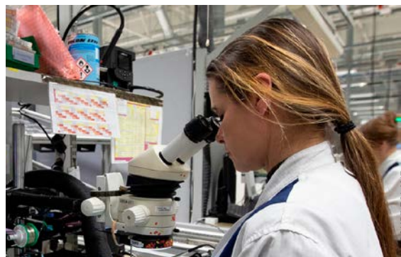
Eolane a régionalisé ses sites français pour être au plus près de ses clients et pour répondre aussi aux commandes étrangères.